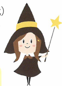
もりサポ 公式キャラクター 「モッチー」

もりサポでは2年前から就職氷河期世代の就労支援を開始し、令和3年度は27名（40代）の方が相談に訪れ、個々の状況に応じてさまざまな支援を行いました。今年度からおおむね50歳くらいの方々まで年齢を引き上げ、就活やキャリアアップをお手伝いします。